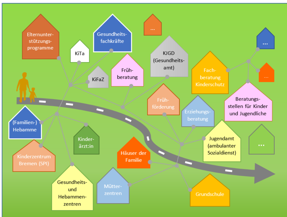
Abb. 1: Beispiel einer Vernetzung der Angebote im Sozialraum von Kindern und Familien

Die obige Abbildung stellt eine beispielhafte und vereinfachte Vernetzung der vielfältigen Angebotslandschaft im Sinne der geplanten Gesamtkoordination und -strategie „Frühe Kindheit“ dar. Neben regelhaften Angeboten wie KiTas und Schulen, Spielplätzen und Sportvereinen unterstützen präventive Angebote der beteiligten Ressorts sowie Strukturen wie etwa der Kinder- und Jugendgesundheitsdienst (KJGD), der ambulante Sozialdienst Junge